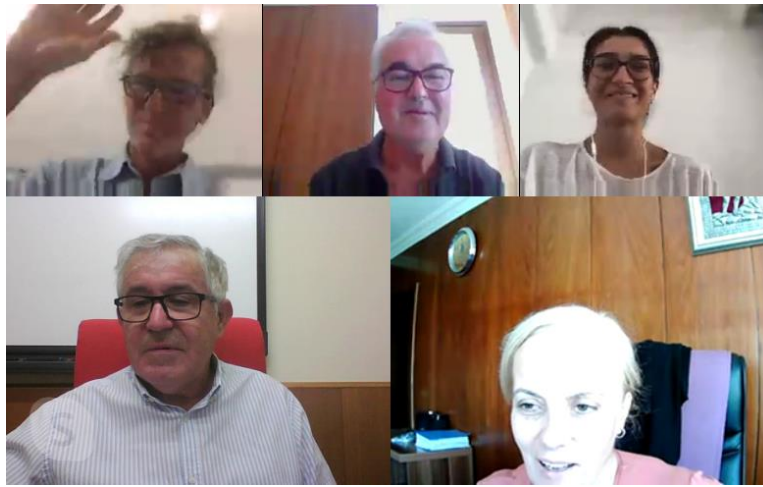
Algunos de los participantes de la reunión en línea del 31 de agosto

En este proyecto, estamos continuamente en contacto a través de las tecnologías de la comunicación como el correo electrónico, reuniones online y por supuesto el teléfono.